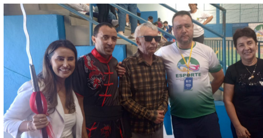
Solenidade de abertura do JEMG