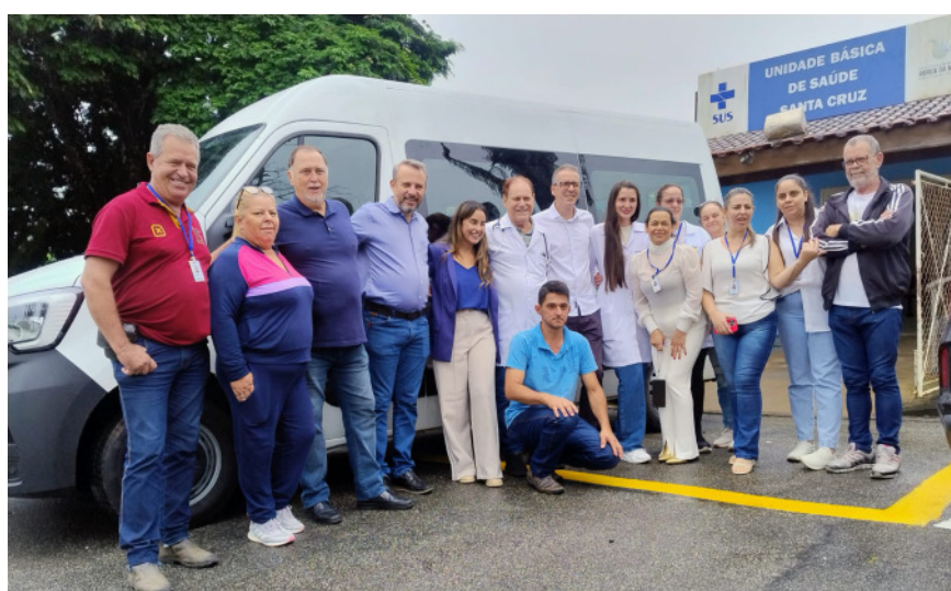
Entrega da nova Van em Borda da Mata