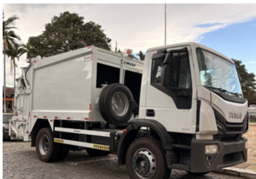
Novo Caminhão para limpeza pública Página 4

Borda da Mata reforça frota de limpeza urbana com aquisição de novo caminhão