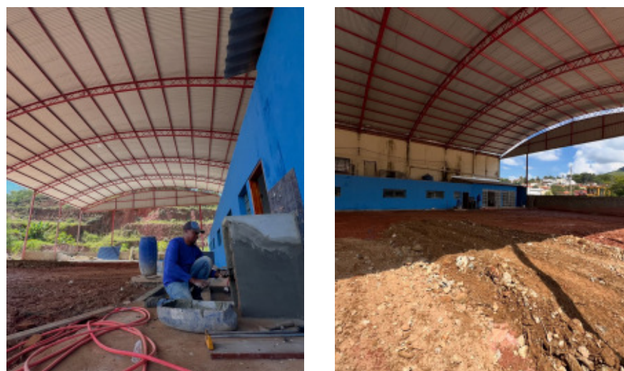
Reorganização da Secretaria de Transportes de Senador José Bento

Nova estrutura da Secretaria de Transporte começa a ser organizada em Senador José Bento