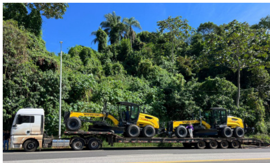
As duas Patrôis novas de Senador José Bento