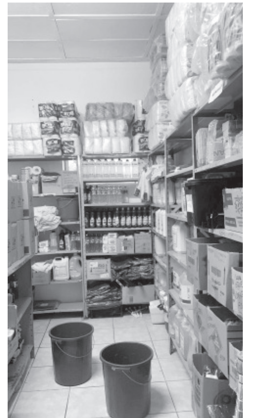
Local onde será construído com vários problemas estruturais