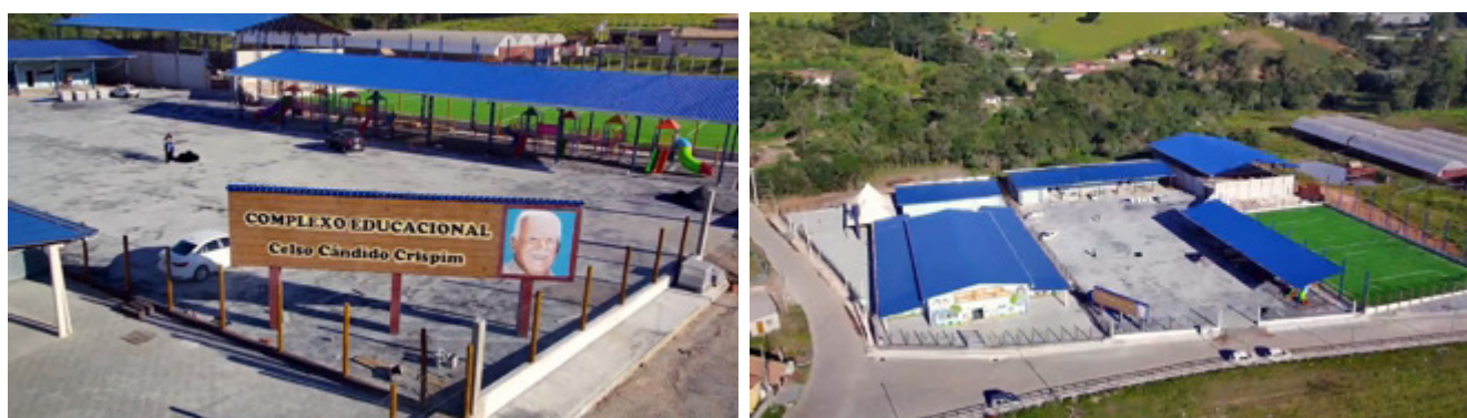
Complexo Educacional no Bairro Damásios