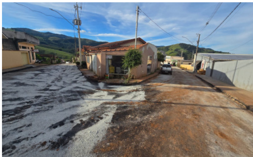
Recapeamento asfáltico no Distrito do Cervo