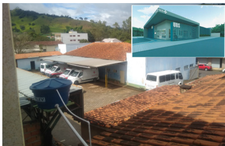
Local onde será a nova UBS e no canto à direita, projeto de como ficará depois de pronta.