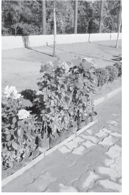
Reforma da Praça da Bíblia