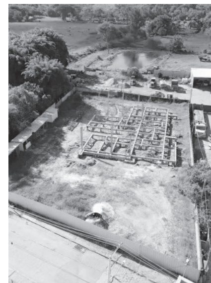
UBS Santa Terezinha

de saúde, contribuindo para melhorar o atendimento e a qualidade de vida da população.