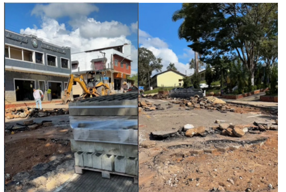
Início das obras do Calçadão em Senador José Bento