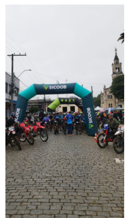
Largada Oficial dos Percursos