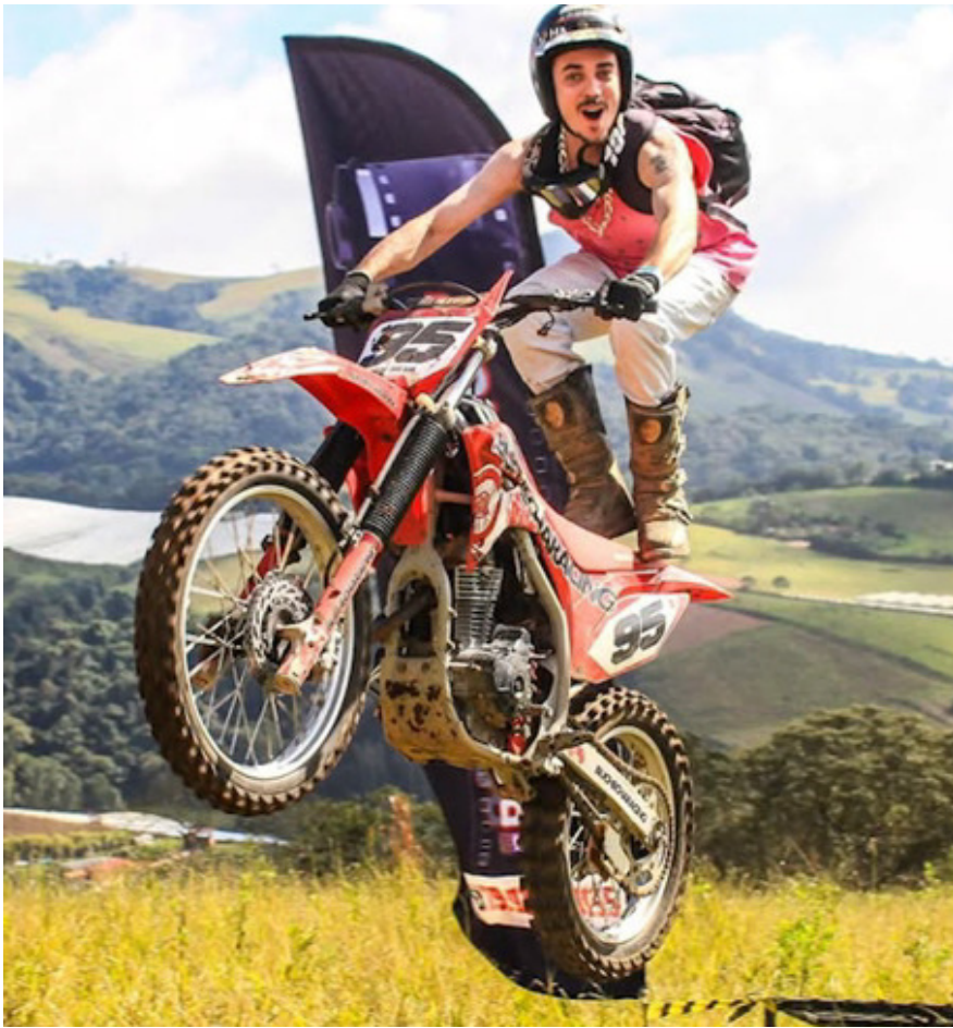
Trilha em prol do Recanto Monsenhor Alderigi

Celebração reuniu famílias, comitivas e visitantes da região em um dos maiores eventos de valorização da cultura rural do município.